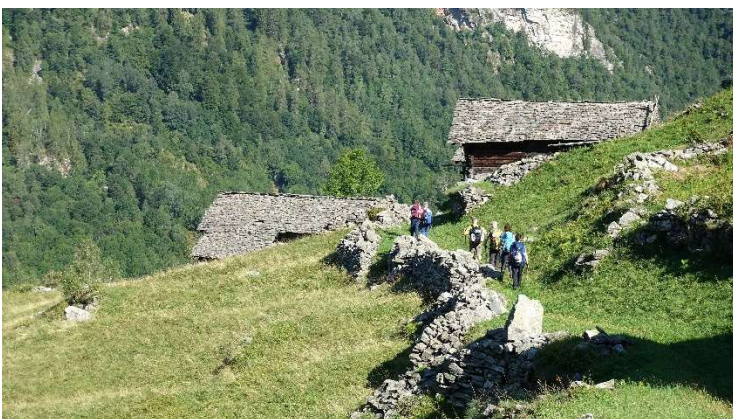
Kurz vor Rossa