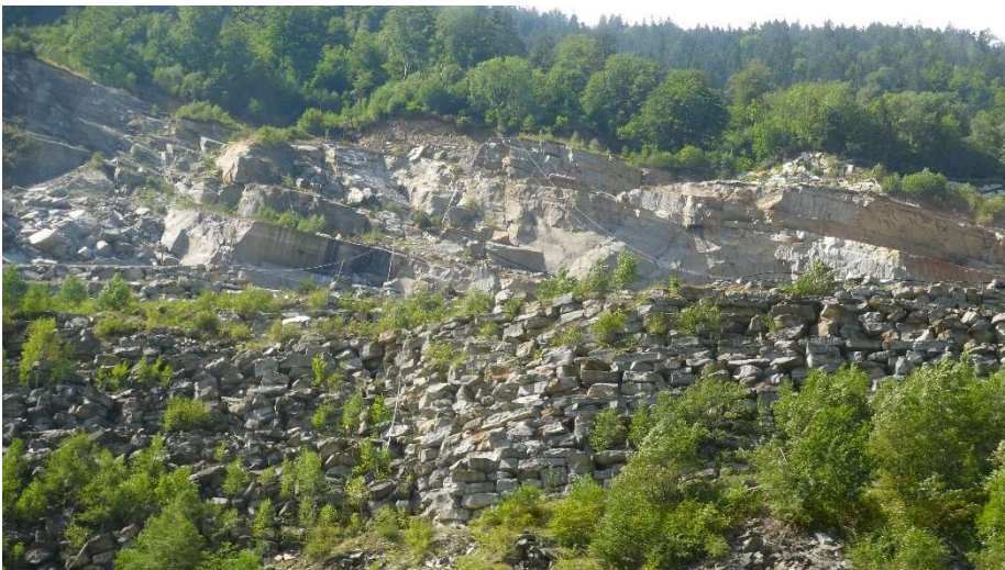
Hier wird der weltweit bekannte „Calanca“ Granit geschlagen