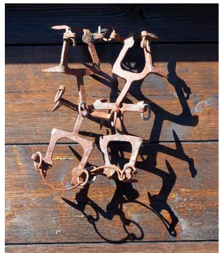
Steigeisen sehen heute noch so aus