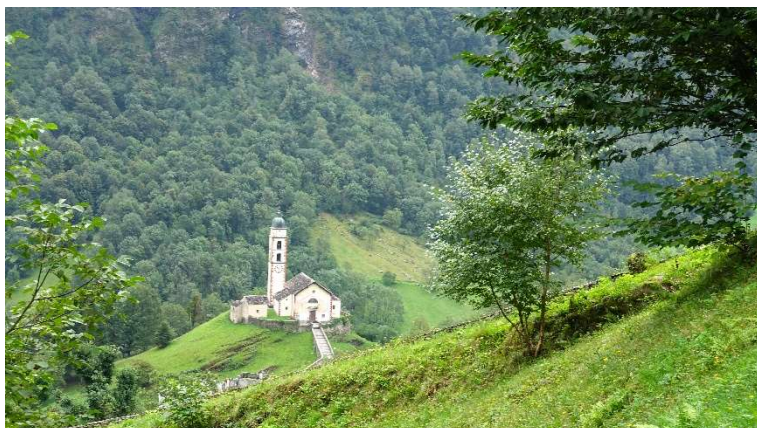
Die Kirche von Soazza