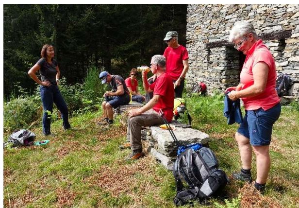
erste Rast 400 Meter weiter oben