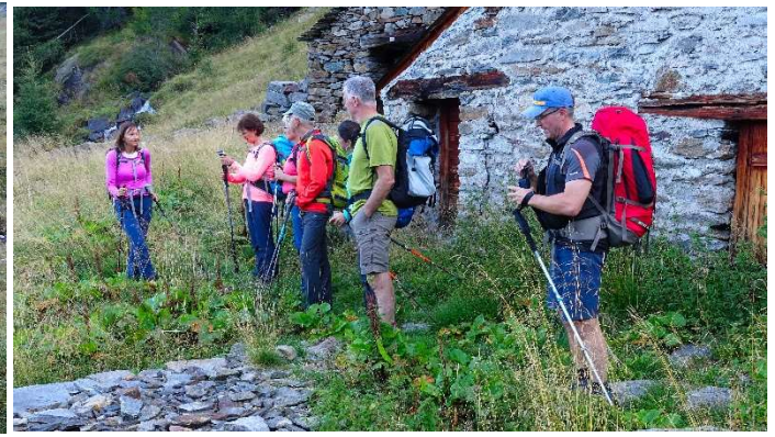
Hier gibt es Neues zu erfahren