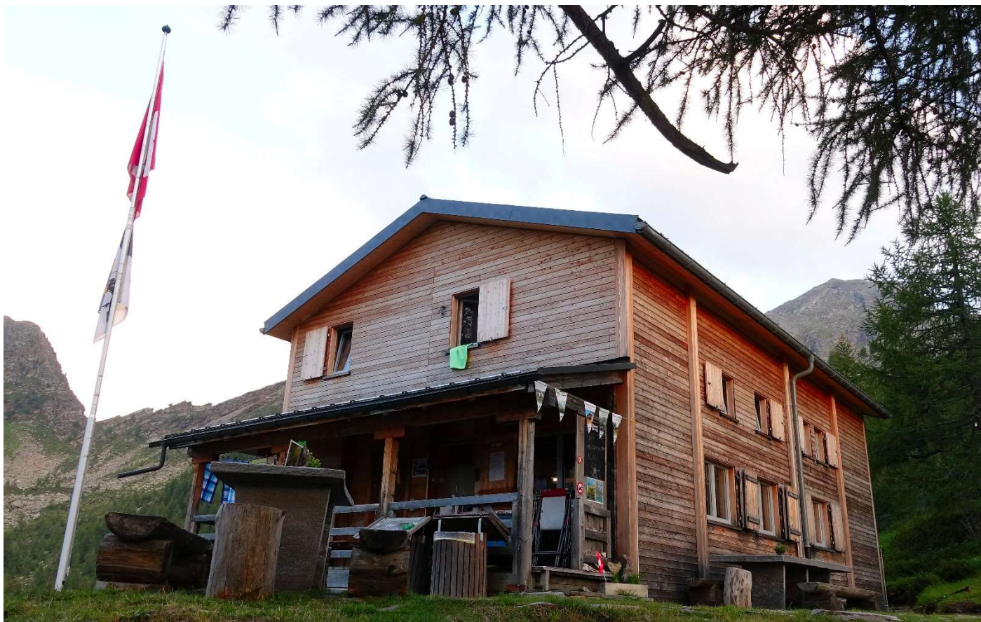
...zur sanierten, sehr modernen Buffalora Hütte