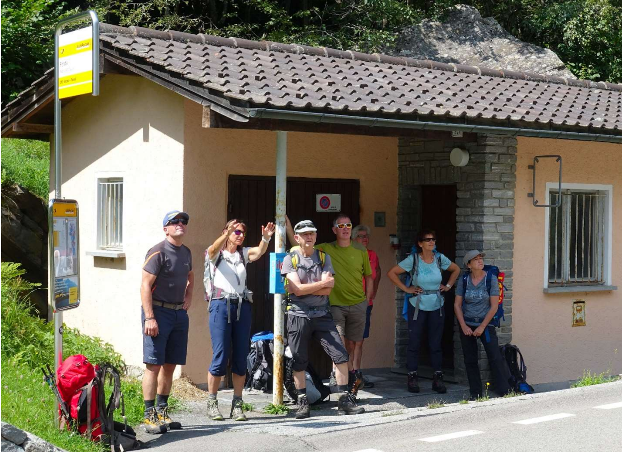
Auch Cauco war Opfer eines Bergsturzes im 16. Jahrhundert