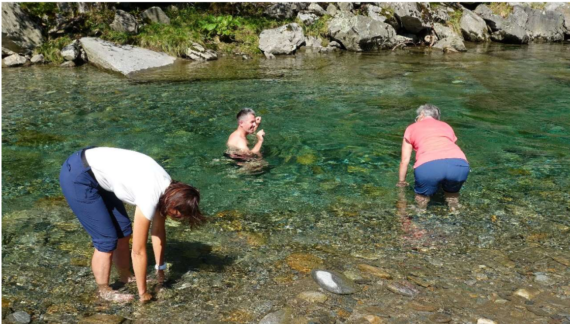
Brrrr... .....kalt in der Calancasca