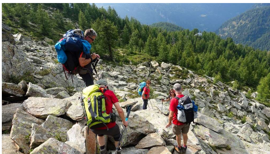
Über Stock und Stein hinunter.....