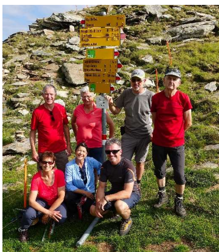
Holla, oben sand's am „Boffalorapass“