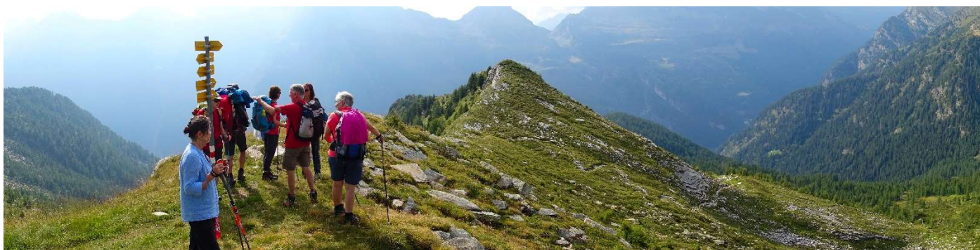
Auf dem Buffalorapass