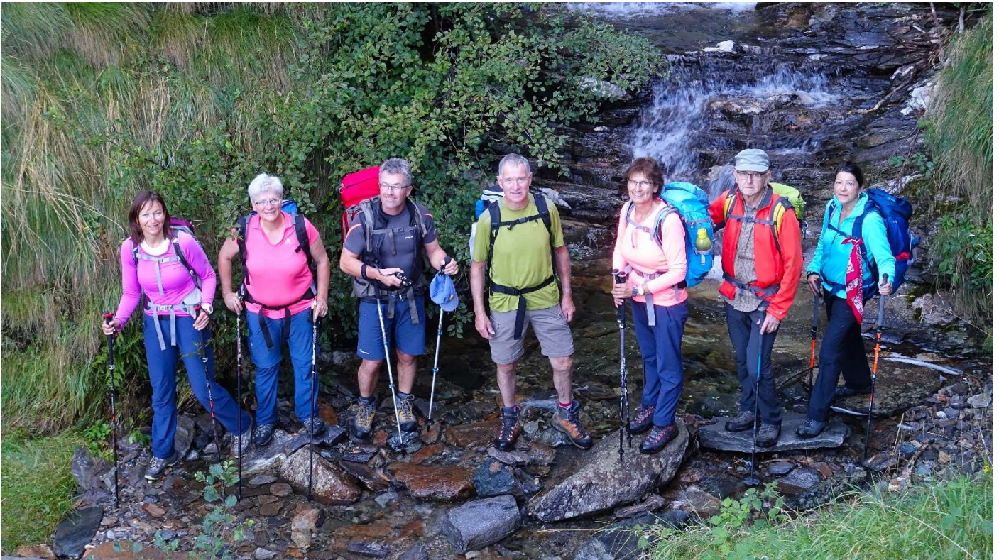
Das passiert, wenn der Fotograf wieder mal der Letzte ist