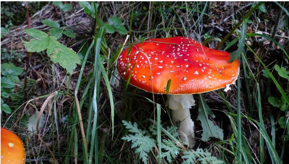
Der alte, gute Fliegenpilz aus den Märchen