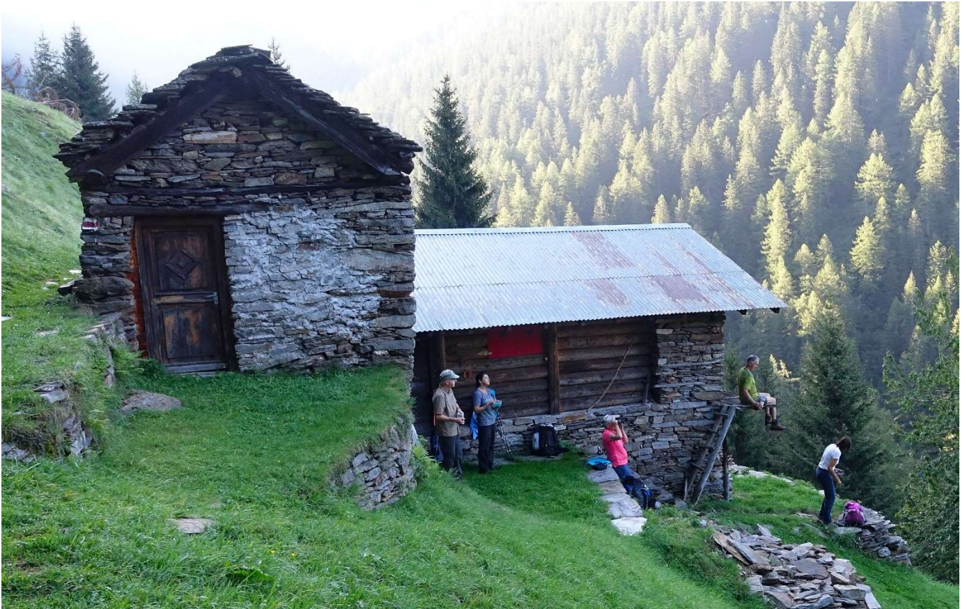
Schöne Alpwiesen in den Waldlücken