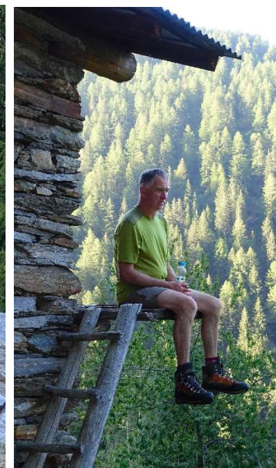
Auf dem Tron hört sich besser